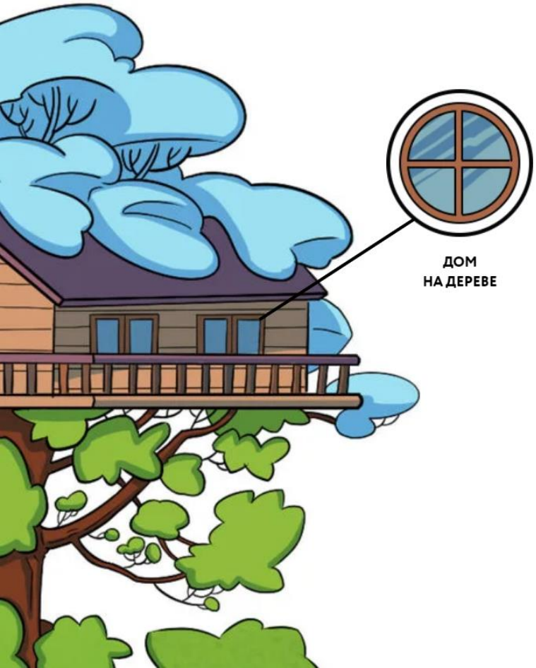
ДОМ НА ДЕРЕВЕ